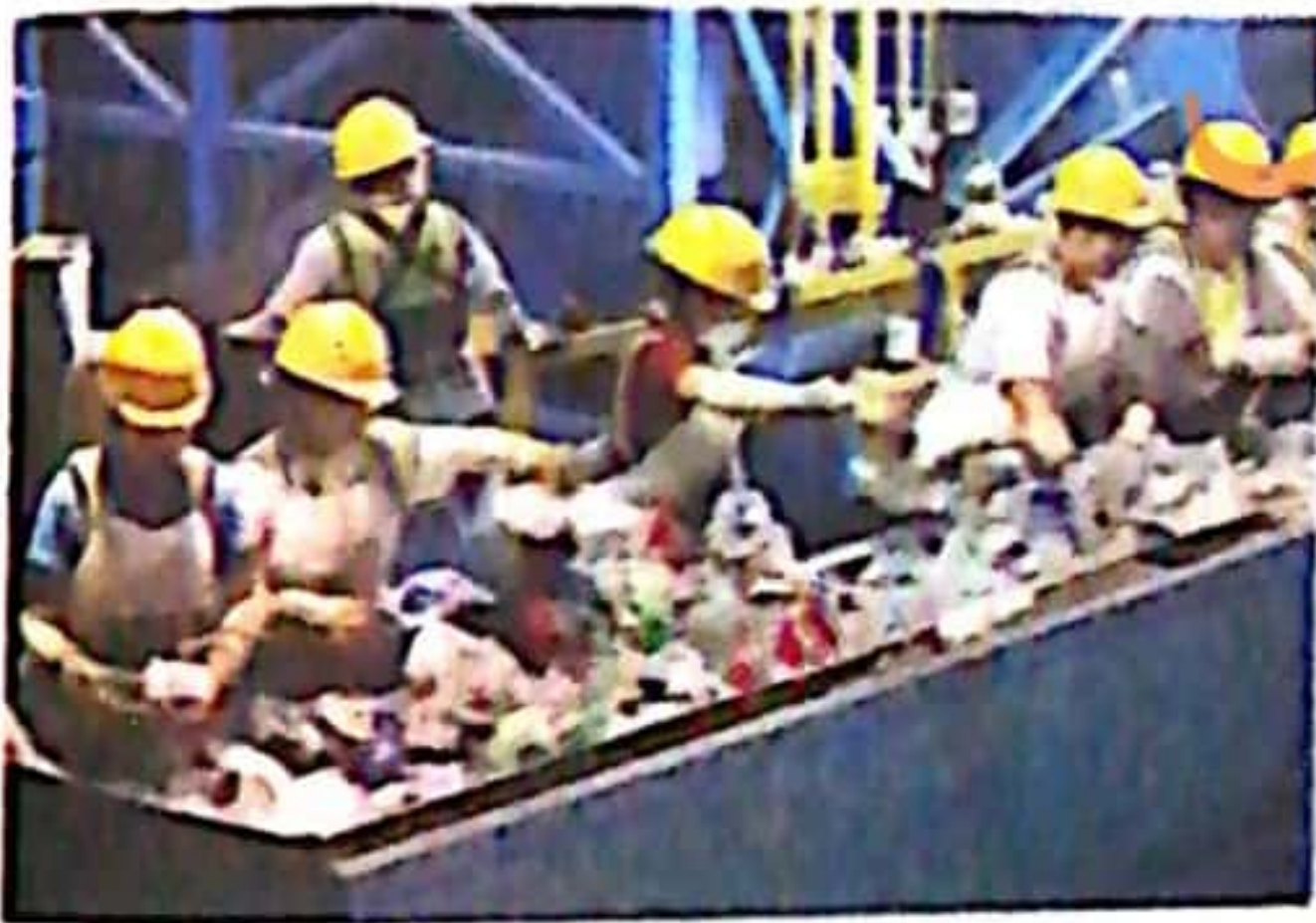
تدوير الزجاجات البلاستيكية